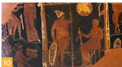
10 Timmari - Necropoli Timmari - Necropolis