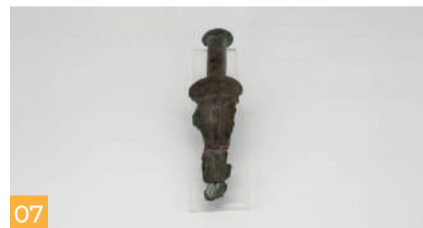
07 Età dei metalli Metal Age