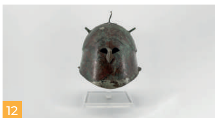
12 Magna Grecia Magna Graecia