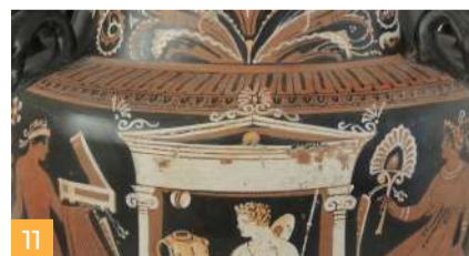
11 Montescaglioso Montescaglioso