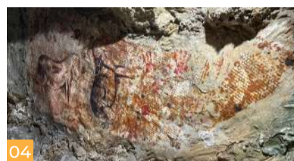
04 Grotta Neolitica Neolithic Cave