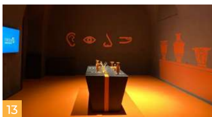
13 'Tiresia, il mito tra le tue mani' 'Tiresia, the myth in your hands'