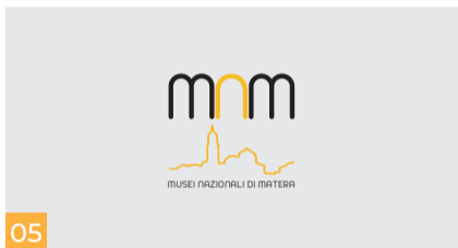
05 Sala in allestimento