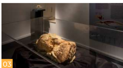
03 Giuliana degli abissi The abyss Giuliana