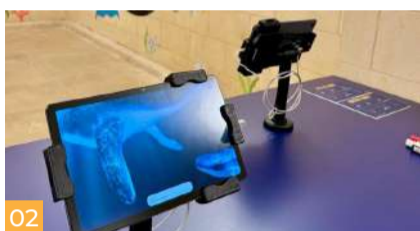
02 Play room - A whales's journey