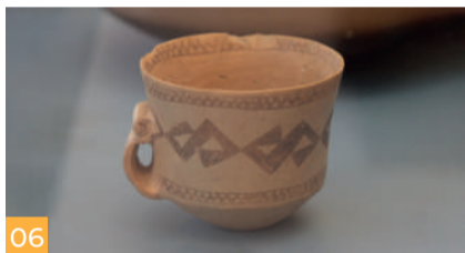
06 Paleolitico e Neolitico Paleolithic Age and Neolithic Age