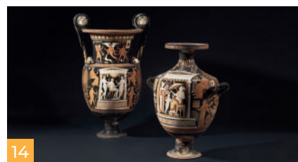
14 Collezione Rizzon Rizzon Collection