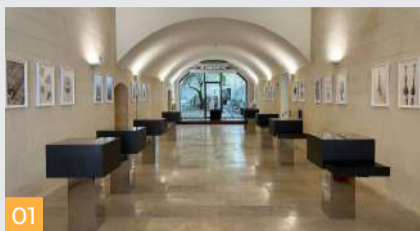
01 Visitor Center