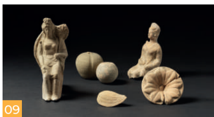
09 Timmari - Stipe votiva Timmari - Votive deposit