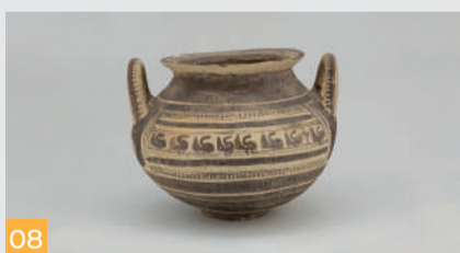
08 Età arcaica Archaic Age